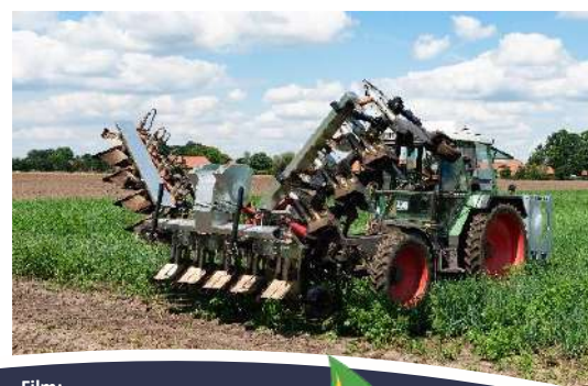
Film: Ukrudsbrændere til landbrug