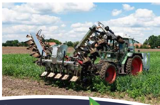
Film: Landbouw onkruidbrander